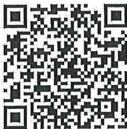
สอบถาม/สมัครอบรม