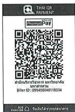
สแกน QR Code เพื่อชำระค่าลงทะเบียน

๔.๒ “สแกน QR Code” ผ่านทางแอปพลิเคชัน Mobile Banking