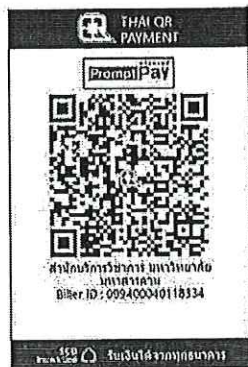
สแกน QR-Code เพื่อชำระค่าลงทะเบียน

๔.๒ “สแกน QR Code” ผ่านทางแอปพลิเคชัน Mobile Banking