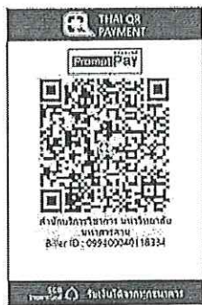
สแกน QR Code เพื่อชำระค่าลงทะเบียน