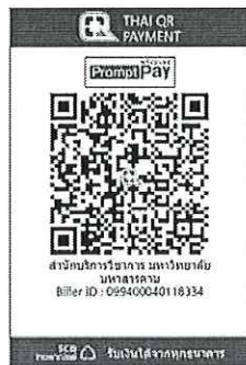
สแกน QR Code เพื่อชำระค่าลงทะเบียน