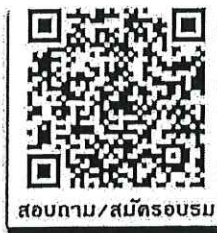
สอบถาม/สมัครอบรม