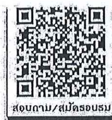
สอบถาม/สมัครอบรม