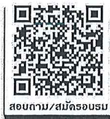
สอบถาม/สมัครอบรม