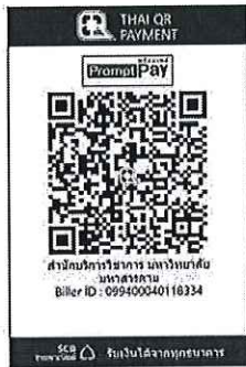
สแกน QR Code เพื่อชำระค่าลงทะเบียน